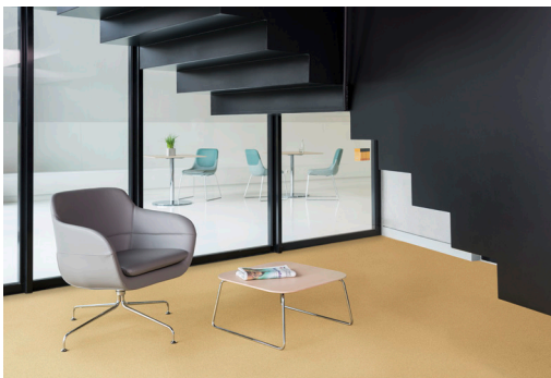
9 Ergänzt wird corona durch passende Couchtische in verschiedenen Höhen.