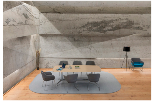
8 Zusammen mit dem passenden Gestell kann der Charakter des Sitzmöbels nochmals deutlich variieren: von einer warmen, wohnlichen bis hin zu einer eher sachlich-kühlen Ausstrahlung.