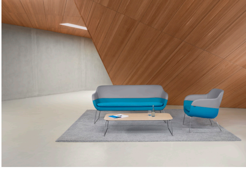
7 In jeder Variante wirkt corona ausgesprochen frisch, jung und einladend.