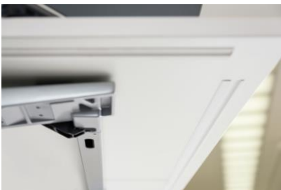
REHAU_Smart Sense Profil