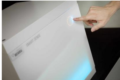
REHAU_Smart Sense Cube_2