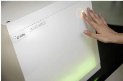
REHAU_Smart Sense Cube_1