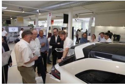
REHAU_Innovation Days_Impres- sionen_2