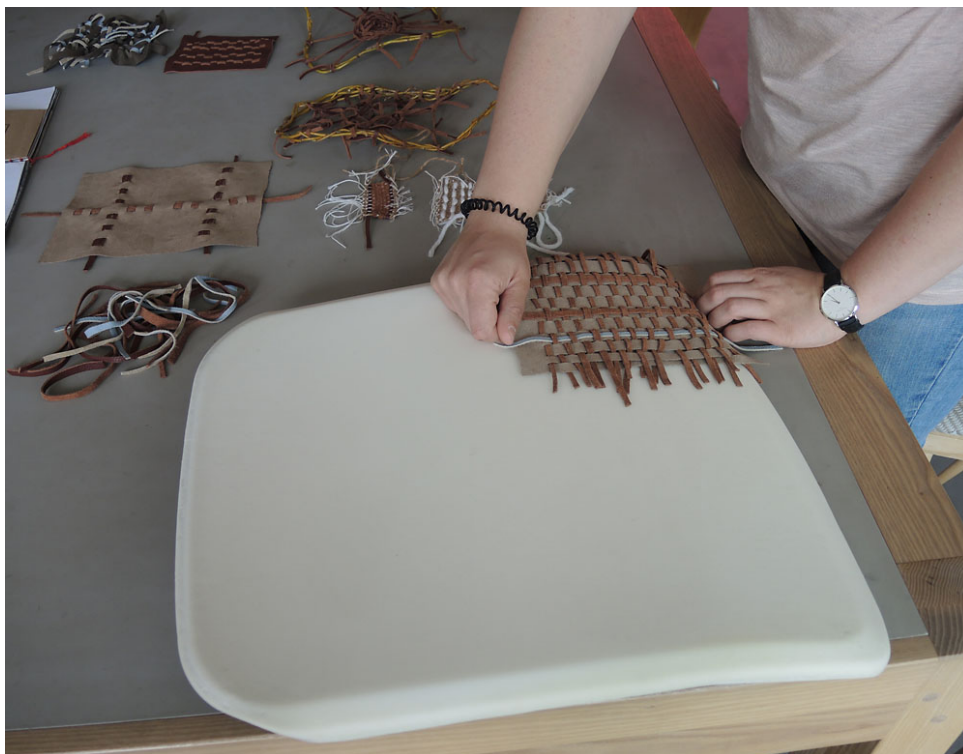
Beim Ideenwettbewerb „Zeit.Bezüge“ sind kreative Entwürfe gefragt.