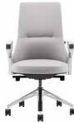
Massaud Konferenzstuhl mit Standardlehne

Die Massaud Conference Seating Kollektion ist ganz dem Komfort und der zwischenmenschlichen Interaktion gewidmet und bietet maßgeschneiderte Sitzlösungen für alle. Individuelles Design für authentische Interaktion.