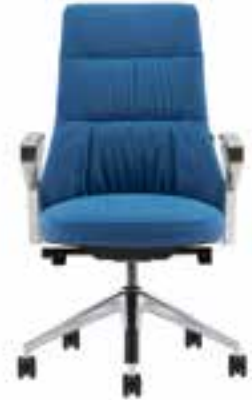
Massaud Duvet-Konferenzstuhl mit Standardlehne