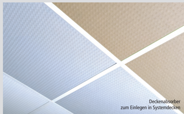
Deckenabsorber zum Einlegen in Systemdecken