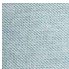
.52 aquamarin meliert