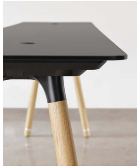
Wählen Sie Laminat, Furnier, Fenix oder Glas für die Arbeitsplatte.

Setzen Sie Zeichen mit unverwechselbaren Designdetails und exklusiven Materialien für Tischoberflächen, Fußgestelle und Fußringe. Tischbeine aus Holz bringen Wärme und Charakter an den Arbeitsplatz und fördern positiv stabile und emotionale Verbindungen der Angestellten zur Bürolandschaft.