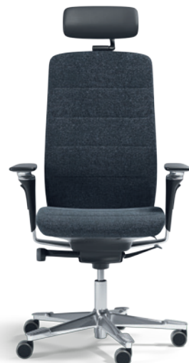
Polished Edition (EDP)