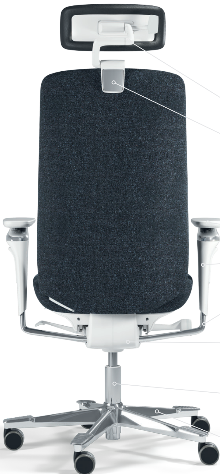
White Edition (EDW)

Nackenstütze Nackenstütze – Rahmen Schwarz, Weiß Nackenstütze – Blende Schwarz, poliert