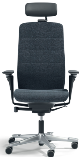
Silver Edition (EDS)