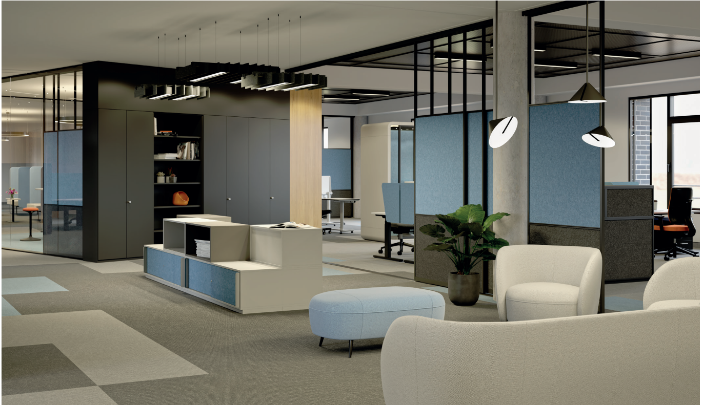
NeoTex Produkte auf den Abbildungen: Raum-in-Raum-System CrossBox, Tischansatzwand Mono, Deckenabsorber Cloud, Schranksystem CombiNeo, Raumgliederung FlexsWall