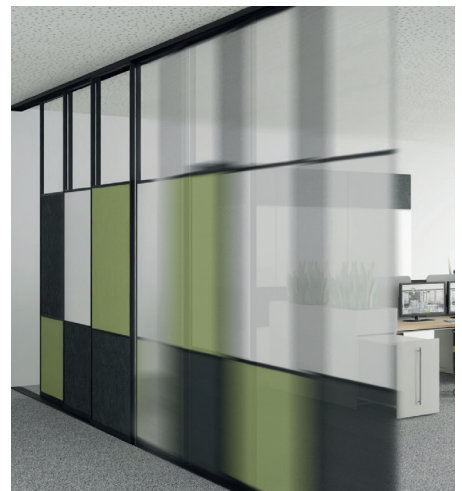
NeoTex Produkte auf den Abbildungen: Schranksystem CombiNeo, Medienwand CrossMeet Connect, Raumgliederung FlexWall

Für detaillierte Informationen zu unseren NeoTex Produkten und deren akustischen Eigenschaften kontaktieren Sie uns gerne.