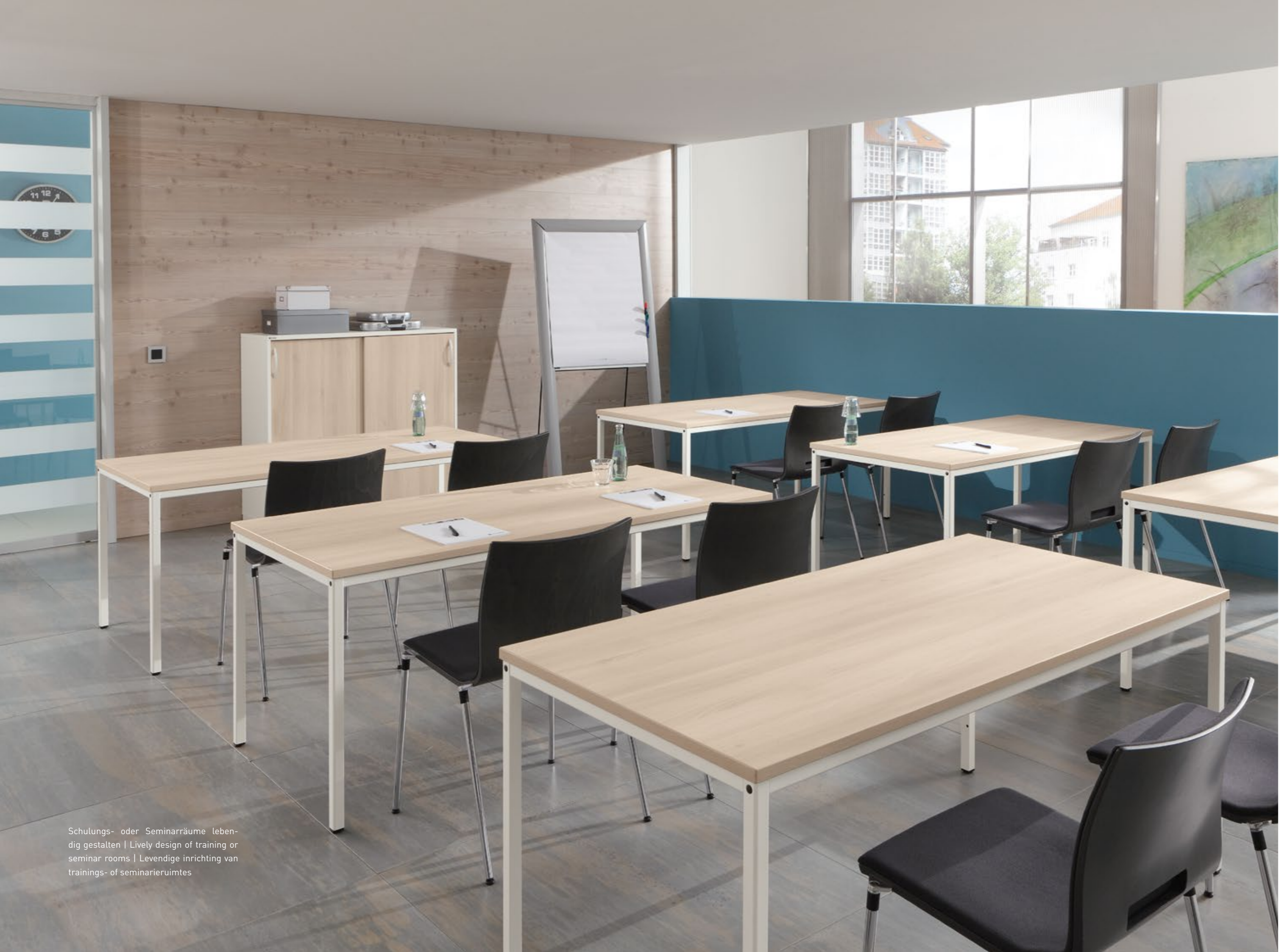
Schulungs- oder Seminarräume lebendig gestalten | Lively design of training or seminar rooms | Levendige inrichting van trainings- of seminarieruimtes