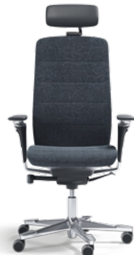
Polished Edition (EDP)