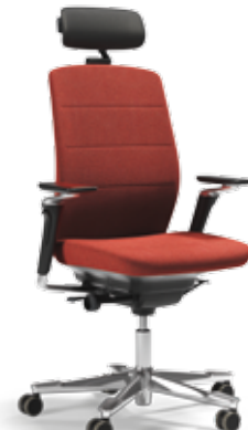
CF111 (Armlehne + NC-Nackenstütze)