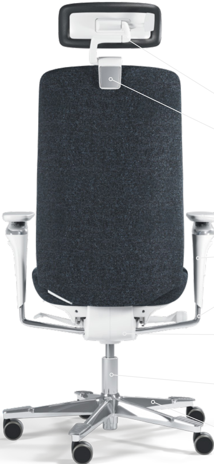
White Edition (EDW)

Nackenstütze Nackenstütze – Rahmen Schwarz, Weiß Nackenstütze – Blende Schwarz, poliert