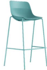
crona light bar