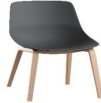
crona light lounge