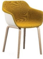
crona light touch