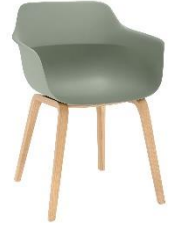
crona light eco