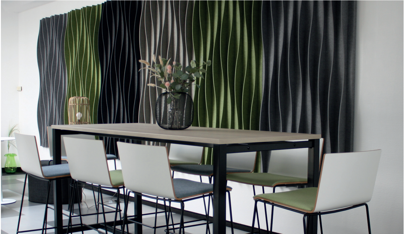
CEKA-Produkte auf den Abbildungen: NeoTex-Wandabsorber Wave, NeoTex-Stellwände, CenFormX-Stehtisch, CrossWorxs, CrossBox