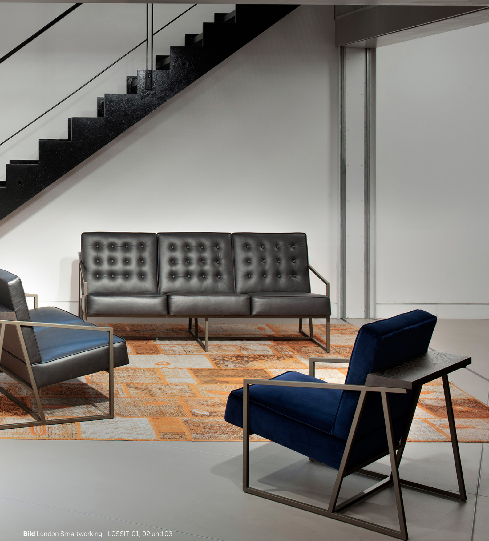
Bild London Smartworking - LOSSIT-01, 02 und 03